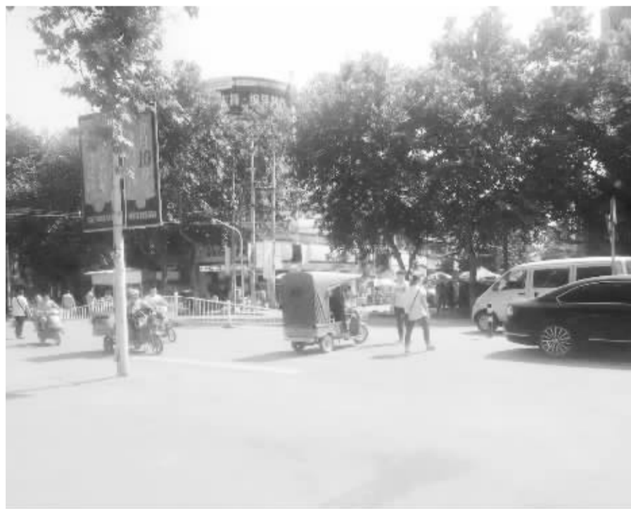
左图:中州大道一峰生活广场门前终于告别了“脏、乱、堵”。