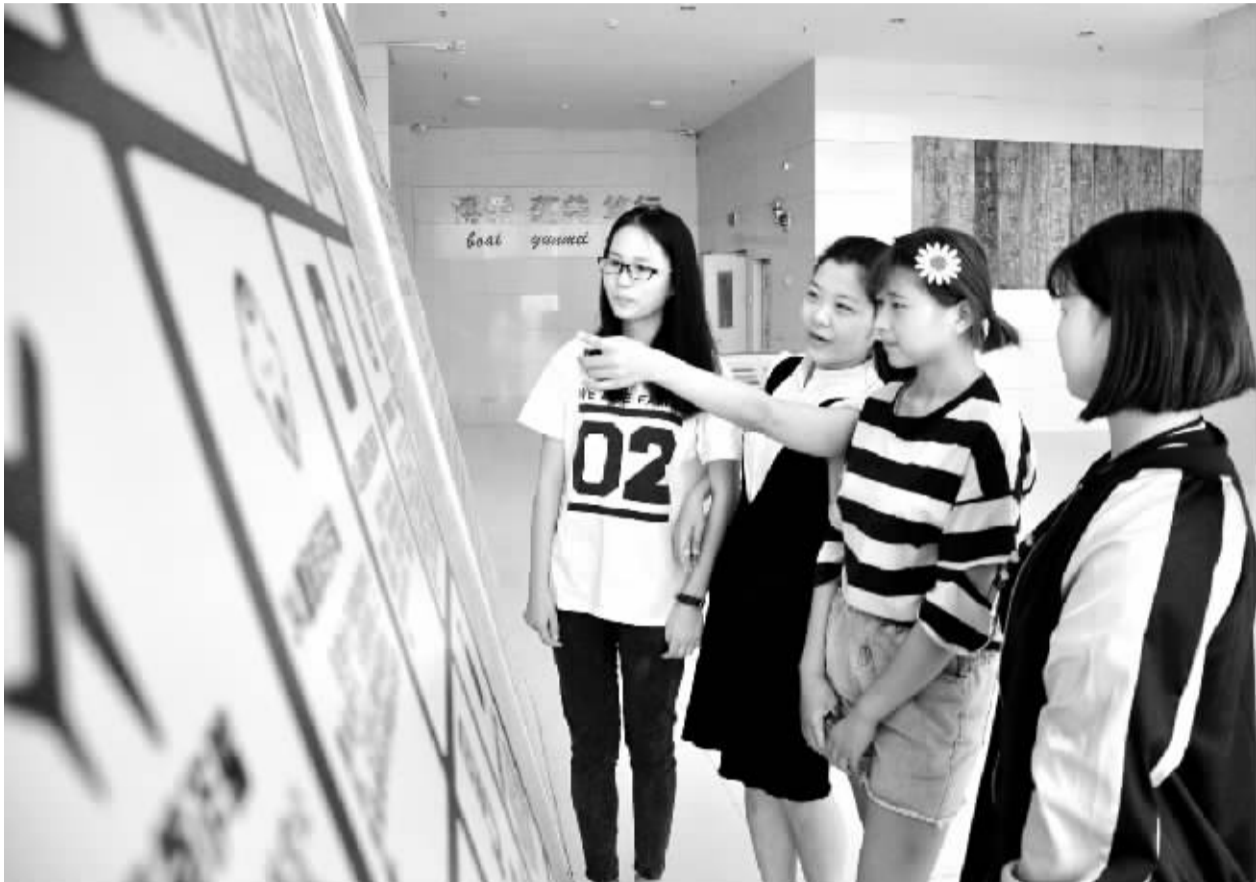
昨日,周口幼师师范学校几名师生在观看防电信诈骗展板。目前进入了开学季,学生、老师成了诈骗分子重点关注对象,该校迅速作出反应,推出不同形式的防电信诈骗宣传活动,详细介绍当前常见电信诈骗的手段、特点、形式和危害,帮助同学们了解电信诈骗的相关知识,提升了广大师生的自我防范能力。