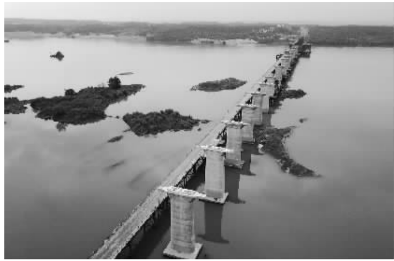
蒙华铁路赣江特大桥线下工程基本完工

为母基金,子基金由母基金以参股方式,在市、县发起设立,将财政资金的政策引导作用辐射全省。基金投资实现的收益和本金收回后,应按照合伙协议约定进行分配,其中财政投资实现的收益及退出投资收回的资金继续用于滚动发展,扩大基金规模。 据了解,河南省中小企业发展基金由河南省财政厅出资10%,中原银行出资90%。基金不得投资股票、期货、外汇、房地产以及国家和河南省政策限制类行业。