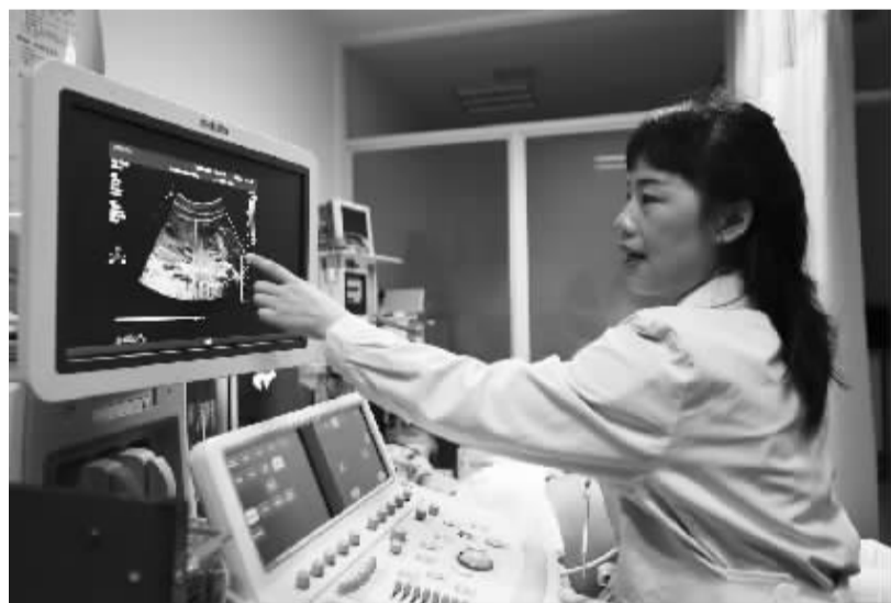
重庆完成心脏复杂畸形胎儿完整数据集采集

在共享单车发展过程中,押金监管是一个备受关注的话题。 按照全国共享单车累计投放车辆超过1000万辆来估算,押金收取的标准为99元至299元不等,这意味着将形成一个较大规模的“押金资金池”。如果企业监管不力,可能会给用户的押金安全造成风险。 中国政法大学教授李俊慧说,共享单车的押金打破了传统“一个租赁物对应一份押金”的模式,形成了“一个人对应一份押金”的模式。基于互联网的优势和特点,使得其具有了一定的资金归集功能。 征求意见稿提出,鼓励互联网租赁自行车企业采用免押金方式提供租赁服务。企业对用户收取押金、预付资金的,应严格区分企业自有资金和用户押金、预付资金,在企业注册地开立用户押金、预付资金专用账户,实施专款专用,接受监管等,并要求建立完善用户押金退还制度。此外明确了相关支付结算要求。 (新华社北京5月22日电)