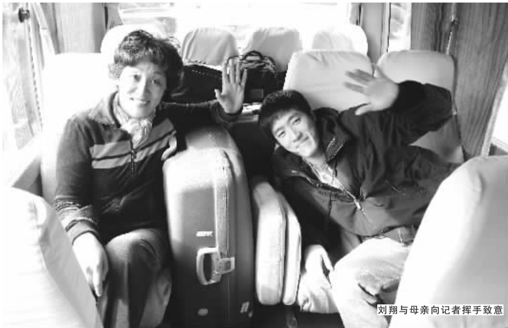
刘翔与母亲向记者挥手致意

手术成功充满信心,同时让这位母亲快活的是,从现在开始她可以跟儿子朝夕相处4个月了,“我很久没和儿子在一起待这么长时间了,很开心,(这个时候)我等了很长时间了!”