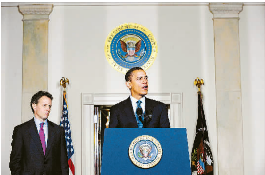
2月4日,美国总统奥巴马(右)与财政部长盖特纳在白宫就美国公司高管薪酬问题发表讲话。奥巴马当日宣布,接受联邦政府大笔金融救助款的企业高级管理人员年薪不得超过50万美元。

在接受救市款的企业中,规模最大的分别是花旗集团、美国银行、美国国际集团、通用汽车公司和克