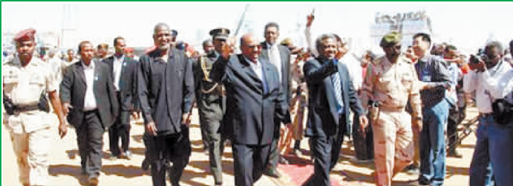
▲苏丹总统巴希尔5日傍晚出现在喀土穆主要大街上，与当地民众见面。