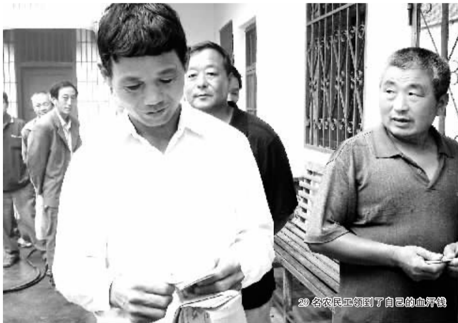
29名农民工领到了自己的血汗钱