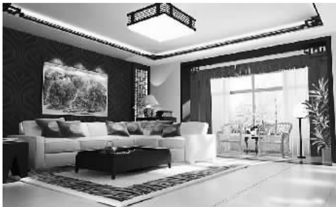
地毯或吸音棉可以减弱室内振动摩擦产生的中低音。

户要严封,不管是单层窗还是双层窗,密封是最主要的。木桶的承载力是由最短的木片决定的,而隔音效果是由最弱的一环决定的。从现在的技术水平来说,用塑钢窗作为密封