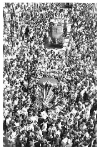
1956 年 7 月 15 日，长春第一汽车制造厂生产出中国第一辆解放牌汽车，从此结束了中国不能生产汽车的历史。这是第一批国产解放牌载重汽车排成长列开出长春第一汽车制造厂的时候，全厂职工夹道欢呼。

1952 年，世界主要国家和地区人均工业产品产量为：钢 82 公斤，煤 724 公斤，原油 242 公斤，电 448 千