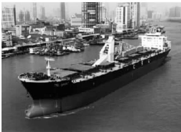
“德新海”散货轮(资料图)