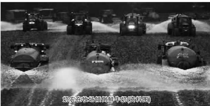
奶农在牧场倾倒鲜牛奶(资料图)

示,2.8亿欧元补贴实际上无法解决欧盟奶业面临的危机,欧盟委员会应拿出一些市场调节措施来解决问题。当天,有大约2000名来自欧盟各国的奶农在卢森堡举行抗议活动,卢森堡出动了约1000名警察维持秩序。