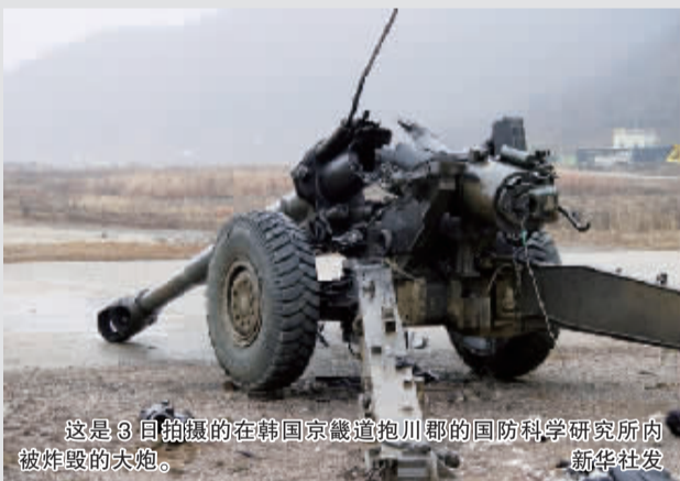
这是3日拍摄的在韩国京畿道抱川郡的国防科学研究所内被炸毁的大炮。

另据路透社报道称，位于韩国首都首尔北部炸弹试验场发生的爆炸，造成6人受伤，其中3人伤势严重。路透社称当地媒体先前报道说，爆炸造成3人死亡，至少60人受伤。韩国国防部官员表示不能确认有人死亡的消息。该试验场位于首尔西北部45公里处，距离朝鲜边界约30公里。