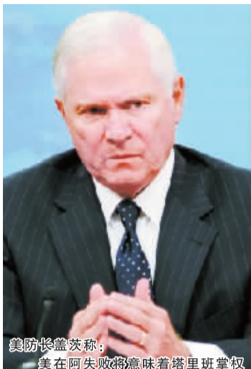
美防长盖茨称：美在阿失败将意味着塔里班掌权