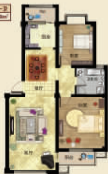
三房二厅二卫 面积约：103m 2

1. 首期首付20000元(20%) 2. 首期首付103元起(按103m 2 计算) 3. 首期首付103元(按103m 2 计算)