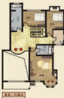
五星一行复式 面积约：208m 2