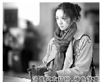
汤唯风衣打扮，神色落寞