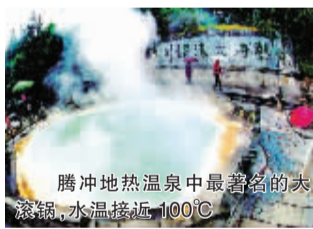
腾冲地热温泉中最著名的大滚锅,水温接近100℃

位于云南和缅甸边境的腾冲,拥有最丰富的火山热海温泉,当地野生菌跟野生茶都是难得的养生膳食。由于以前到腾冲路况不好,只有特种游客才会前往,少有旅行团破坏,因而至今仍然保持着最原生态的自然风光。