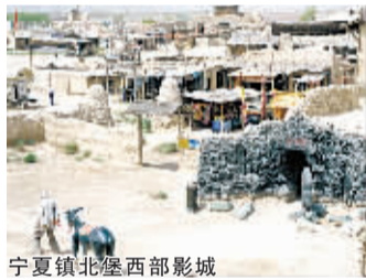
宁夏镇北堡西部影城

对于醉心于文化旅游的游客来说,银川是难得的体验之旅。受气候环境影响,银川旅游旺季主要集中在夏季及秋季。冬季到此,除了避免拥挤,更可在郊外的苏峪口滑雪场,体验丰富多彩的雪地运动。