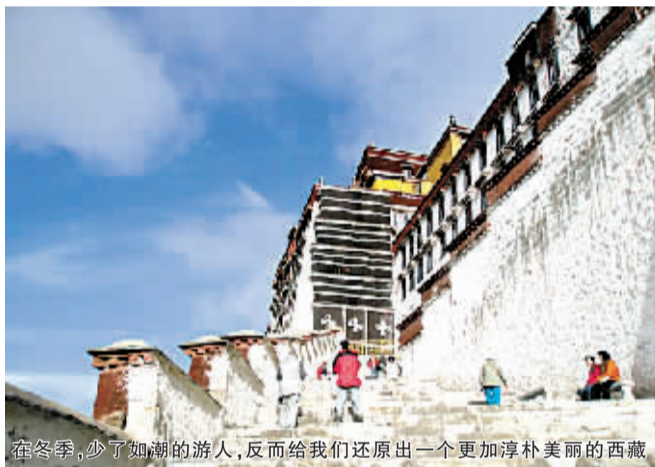
在冬季,少了如潮的游人,反而给我们还原出一个更加淳朴美丽的西藏

西藏的冬天,四处洋溢着静谧的味道。少了如潮的游人,反而给我们还原出一个更加淳朴的西藏。冬天的西藏雨水不多,路况很好。对比旺季,此时去西藏的旅游花销可以节省近七成。