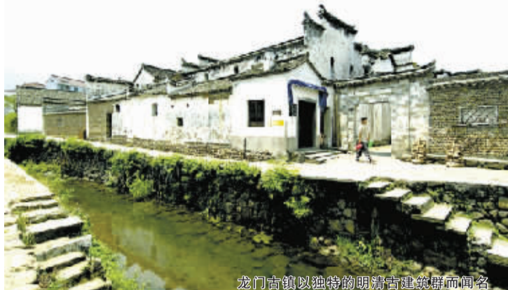
龙门古镇以独特的明清古建筑群而闻名

如果无法抵挡春节黄金周出游的诱惑,又不想在浩浩荡荡的出行大军中淹没,玩点剑走偏锋吧——去游人相对较少、景色奇绝的特色线路,独享一片景区的宁静。