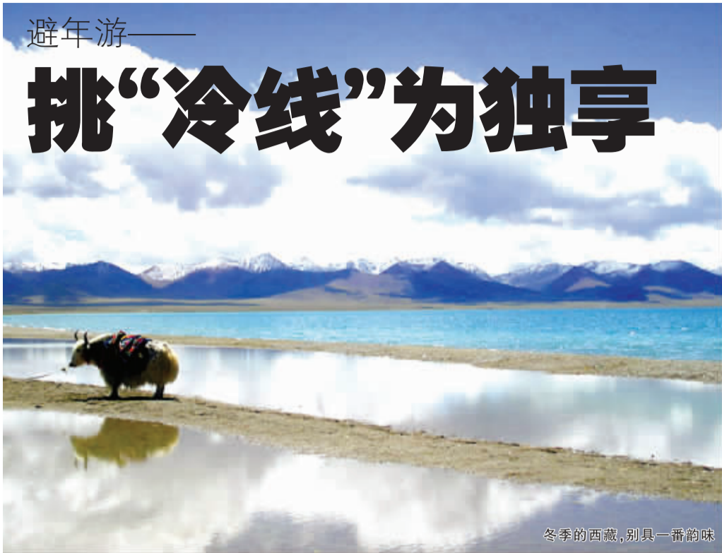
冬季的西藏,别具一番韵味