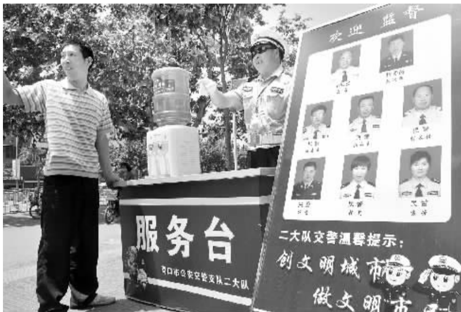
日前,市交警部门在市区一些岗亭设立了“便民服务站”,准备了周口市城区地图、便民笔记本、纯净水等,随时为过路群众提供帮助。图为市交警一大队民警给路人指路。