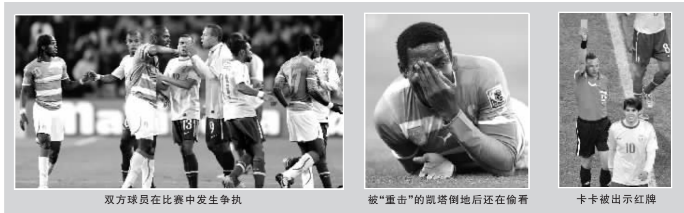
双方球员在比赛中发生争执

非洲大象困兽犹斗 德罗巴带领“非洲大象”发起了反扑,但是“魔兽”的头球对于桑巴军团只是有惊无险。倒是卡卡在左路又给队友埃拉诺制造了良机,后者一蹴而就。那边厢,科特迪瓦主帅埃里克森只能无奈地直摇头。 德罗巴还在引领队友去争取翻盘的机会,但是五星巴西实在是在太难对付了。攻无果,守又失,在急切之中,大象愤怒地向那些价值连城的腿上乱踩。德罗巴总算寻觅到了机会,亚亚·图雷终于将皮球送到了他的头上,进球自然就是水到渠成。 如果时间还能延长一些,“非洲大象”或许会有扳平的机会。何况,在激怒了卡卡送出一张黄牌之后,一个掩面的假动作又将卡卡提前送下了场。不过,一切假设,都因悄然而至的 90 分钟大限戛然而止。 (林本剑)