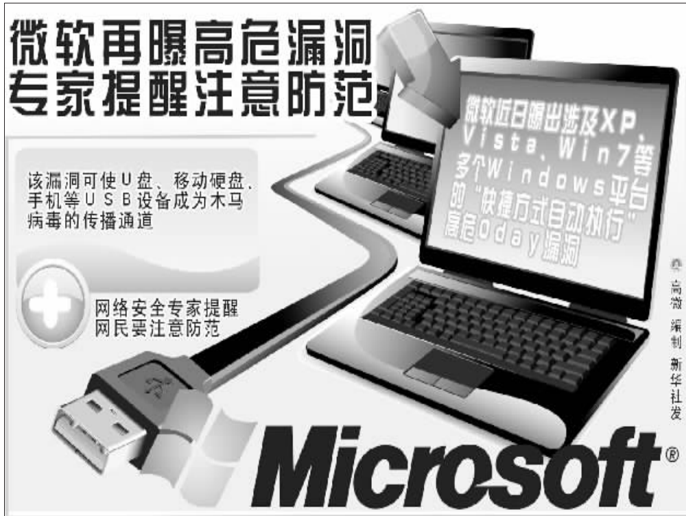
高微编制