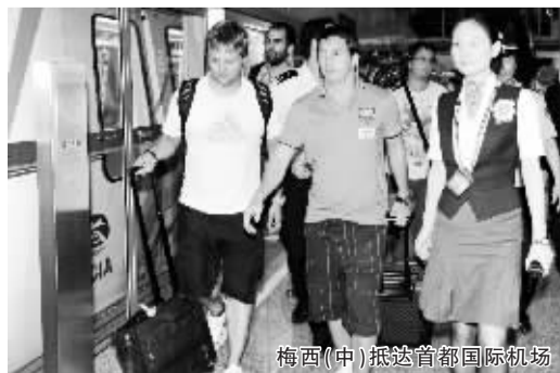
梅西(中)抵达首都国际机场