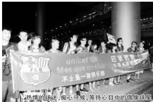
热情的球迷,痴心守候,等待心目中的偶像球星

只不过,面对球迷们的热情似火,巴萨球星们的表现就有些说不过去了。任凭球迷怎样呼唤和尖叫,没有人停下脚步说一句话、打一声招呼,甚至连一个微笑、一个招手都没有,就径直走上了球队大巴。有球迷嘟囔了一句:“也许他们真的太累了……” (关尹)