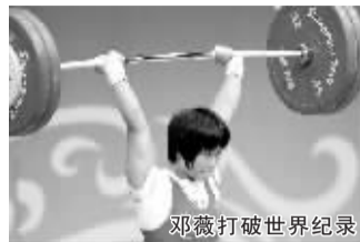
邓薇打破世界纪录

据新华社电 在昨天进行的新加坡青奥会举重比赛中,中国选手邓薇以绝对优势夺得女子58公斤级冠军,并且打破了该项目总成绩的青年世界纪录。