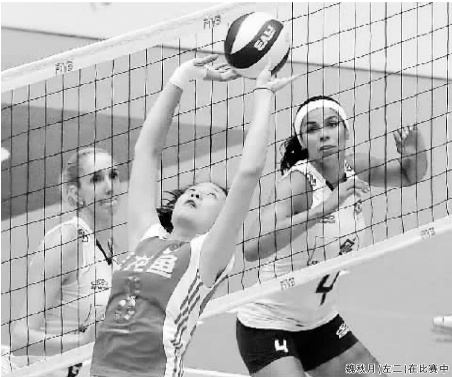
魏秋月(左二)在比赛中