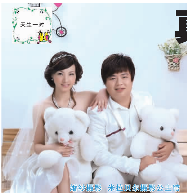
婚纱摄影 米拉贝尔摄影公主馆