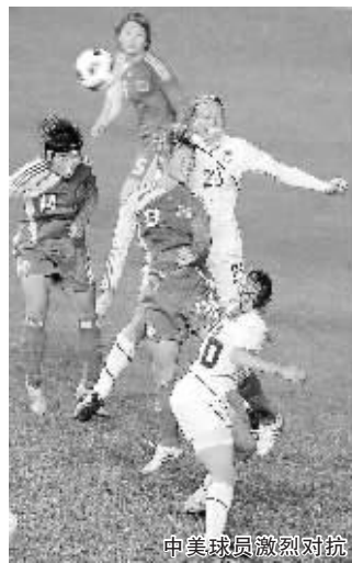
中美球员激烈对抗