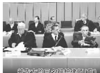
被告方的三名辩护律师(前)

去年底,欧洲警方经过调查取证,揭开了这起欧洲足坛迄今为止最大规模赌球案的面纱。波鸿法院当天的审理仅仅是一个开始,检察机关正在对涉嫌操纵全欧洲270余场比赛的250多名嫌疑人展开调查。据估计,赌球案的全部非法所得高达750万欧元。