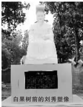
白果树前的刘秀塑像