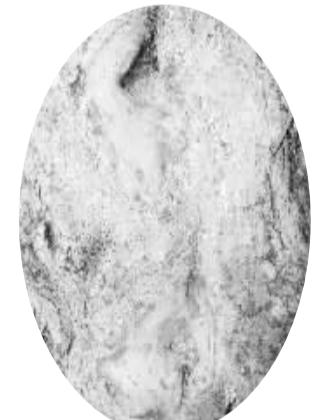
白果树上的“马蹄印”

商水县邓城镇许村有棵白果树,距今已有两千多年的历史,仍然枝繁叶茂。据专家论定,这棵树是河南省现存年代最久远的白果树,在全国也非常罕见,这棵白果树还曾登上过中央电视台的荧屏。日前,记者专程走进许村,寻访这棵汉代白果树。