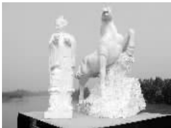
沙河岸边的刘秀饮马台