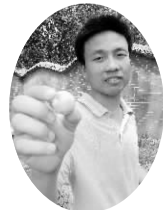
白果树结出的果子

站在白果树下,人们在景仰这棵千年古树的同时,无不被它所彰显的倔强性格和顽强生命力所折服。树犹如此,人何以堪?千年白果树啊!世人深深地爱恋您,只因为您身上蕴藏着太深的人生哲理!