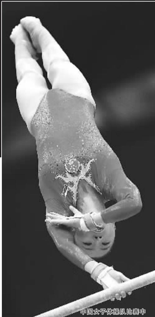
中国女子体操队比赛中

“从整体实力上看，我们有希望拿冠军，今天确实有些不尽如人意。”赛后，体操女队总教练陆善真坦言，“高低杠作为我们的强项，今天出现两次失误，很不应该，这值得我们好好总结。”显然，面对新实施的633赛制，中国队的姑娘们依然有些不适应。其实，如果哪怕少失误一次，金牌都很可能归属中国队。正是太多的失误，葬送了大好局面。只是，赛场上永远没有“如果”两个字。（关尹）