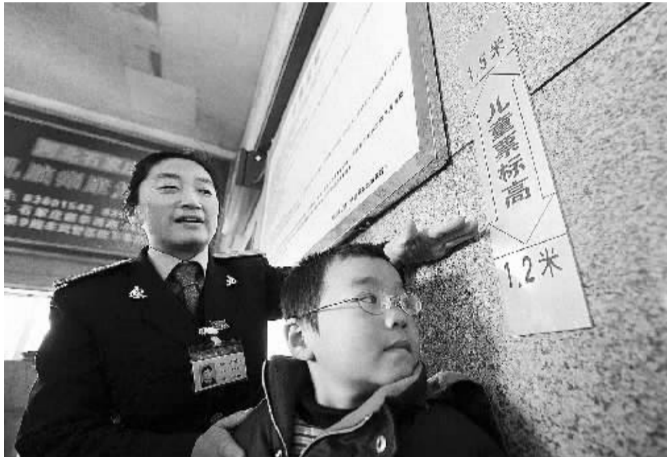
11月29日，石家庄火车站的工作人员为儿童测量身高。

据铁道部最新修订的《铁路旅客运输规程》，12月1日起，铁路儿童票的身高标准调整为1.2米—1.5米，身高1.2米以下的儿童乘坐火车将无需购票。目前，石家庄火车站已经把新标准的身高测量标识安放在售票厅、检票口等处。