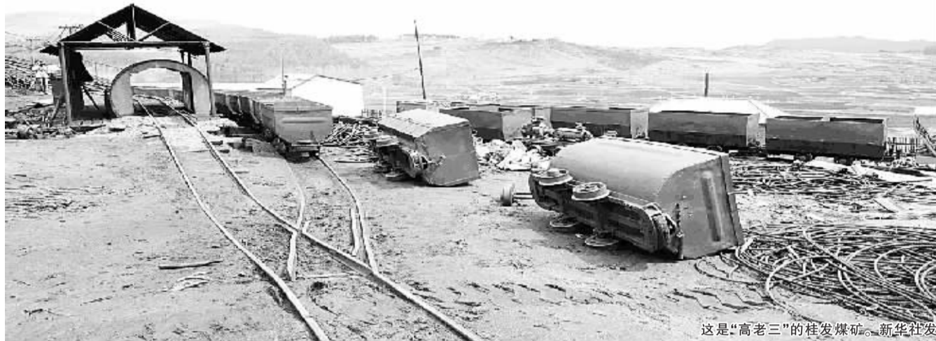
这是“高老三”的桂发煤矿。

到底谁在瞒报矿难?瞒报的目的是什么?4月26日傍晚,接到群众举报鸡西市滴道区发生矿难后,记者即连夜赶赴现场采访。采访过程中发现的种种疑点,或许能揭开矿难瞒报事件真相的冰山一角。