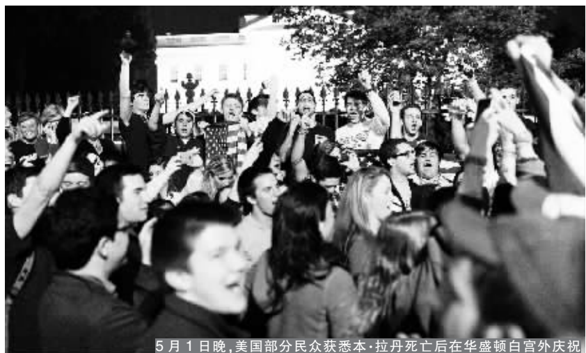
5月1日晚,美国部分民众获悉本·拉登死亡后在华盛顿白宫外庆祝