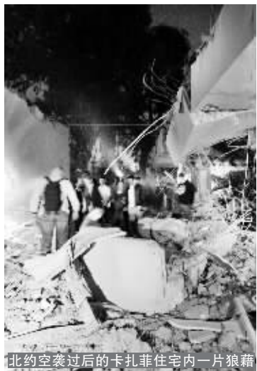
北约空袭过后的卡扎菲住宅内一片狼藉

这是东电发现第二名遭过量核辐射的女性员工。先前一名50多岁的女员工检测出遭到17.55毫希辐射。