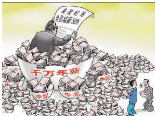
不是碗多,而是碗大