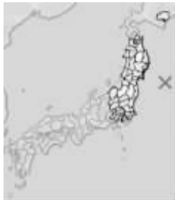
日本气象厅发布:当地时间7月9日9时57分(北京时间8时57分),震中为三陆冲(北纬38.0度,东经143.5度),震源深度30公里,震级为里氏7.3级。美国地质局数据则为:地震震级里氏7.0级,震源深度34.9公里。

当地时间7月10日上午9时57分,日本本州岛发生7.1级强烈地震,当局已经向岩手、宫城和福岛地区发布海啸预警。后来,日本气象厅将10日上午发生的地震震级从里氏7.1级修正到里氏7.3级,震源深度从10公里修改为30公里。