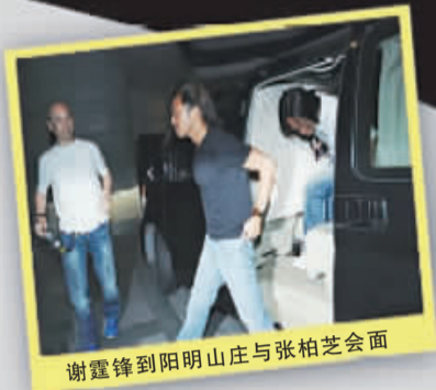
谢霆锋到阳明山庄与张柏芝会面