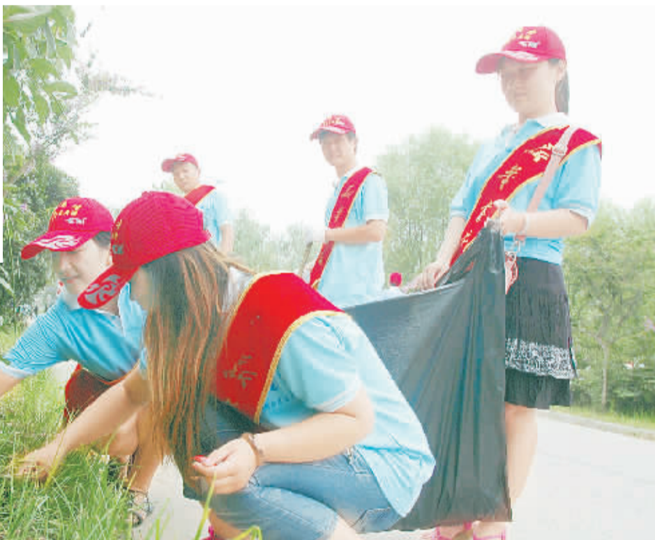
7月18日,淮阳组织县直各单位的党、团员等青年志愿者2000余人走上街头捡拾垃圾,清扫卫生,并帮助环卫工打捞蔡河河面上漂浮的垃圾,开展青年志愿者集中宣传活动,为创建国家级文明城市尽一份力。