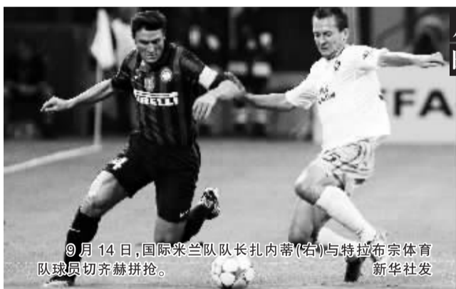
9月14日,国际米兰队长扎内蒂(右)与特拉布宗体育队球员切齐赫拼抢。

本报综合消息 特拉布宗是支什么队?恐怕绝大多数人从来没有听过。事实上,这支土耳其新军还是第一次参加欧冠,十足的名不见经传。相比之下,国际米兰的名字简直是如雷贯耳。没想到的是,蓝黑军团昨晨在小组赛首轮就0比1输给了特拉布宗,而且还是在主场。