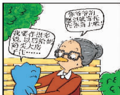
储存梦想 (迪尔西斯) niki 作