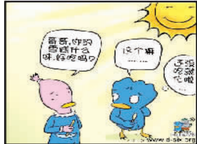
慢一点 (迪尔西斯) niki 作