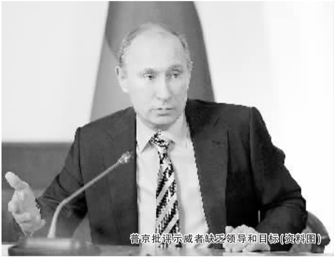
普京批评示威者缺乏领导和目标(资料图)

俄罗斯总统候选人登记于1月18日结束。从目前情况看,包括总理普京在内的7位候选人将可能最终获得登记许可,参加今年3月份举行的总统选举。