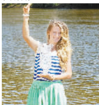
阿扎伦卡来到墨尔本亚拉河畔展示奖杯并拍照留念。

中国球迷一个惊喜。在摆脱了手腕的老伤后,郑洁的进攻能力得到有效的恢复和提升,同时也拥有了与一流球员竞争的实质。而在开年首个大赛上就进入到八分之一决赛,也为今年的比赛和伦敦奥运会与彭帅的双打开了个好头。