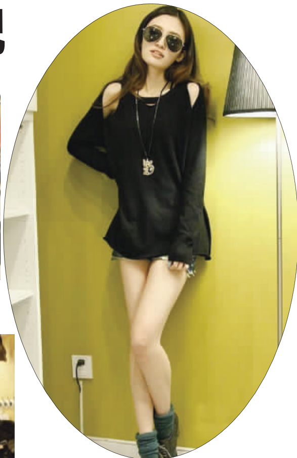
最大的亮点是露肩的设计,插肩袖样式,两肩挖空露肩,衣领的前后镂空,极具性感神秘色彩。