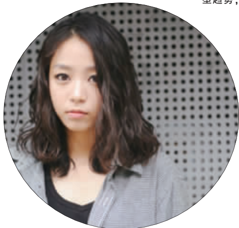
中长发侧分的烫发、电发,这样的湿发设计是不是很有性感欧美发型的look呢,抛弃一如既往的大卷发,这样的小卷也很深入人心。

韩式发型一直是时尚发型的最高指标之一,2012最新出炉的韩式烫发、电发指导你走出新的时尚发型趋势,用最新最时尚的招数打造最完美的脸型,让你拥有超高回头率。