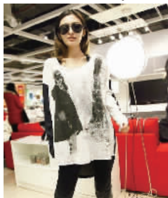
水洗吊染的一款长袖T恤,面具女人的图案,呈现出一种独特的文艺气息。