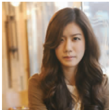
长发卷发打造复古发型风,非常浓密的柔顺秀发,健康有质感的发型设计,同样采用高层次剪发设计。