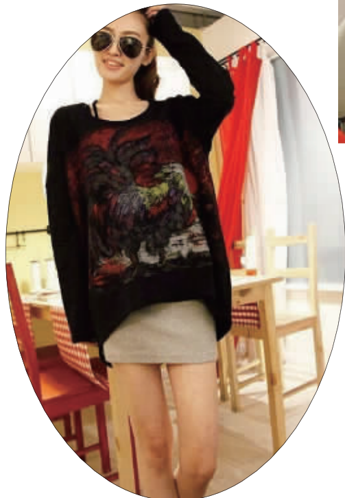
不对称衣摆设计,体现休闲随意性,同时强调特立独行的不羁风格。