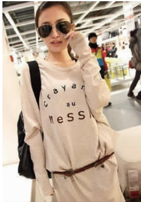
v 领设计长袖T恤,胸前字母印花,两侧大口袋,强调休闲效果,长袖蝙蝠袖设计,宽松版型,都很好穿。