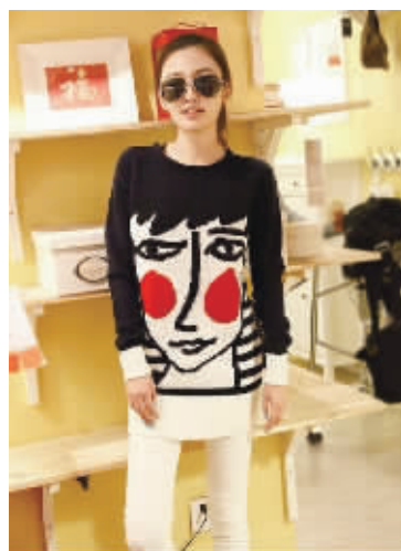
文艺气息浓厚的套头毛衣,可搭配空间大。圆领设计,宽松版型,可搭配不同单品打造不同风格的造型。