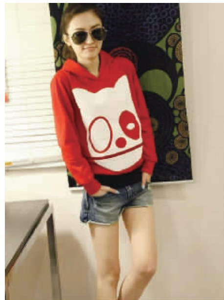
连帽套头的宽松款式,大多数身材均适宜。胸前机器印花图案,狗狗的嘴巴是拉链设计,可拉开,充满童趣感。(黑子)