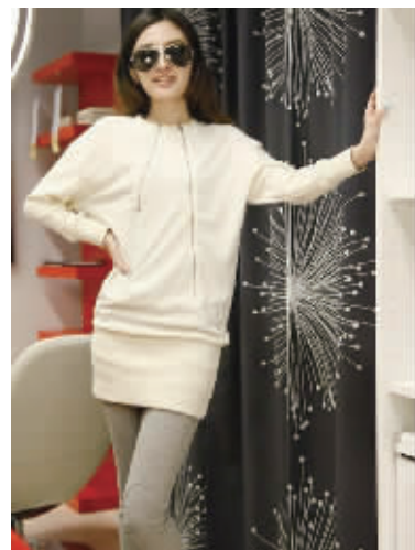
双拉链不对称设计,个性十足,拉链采用金属银光材质,提升衣服整体的质感。