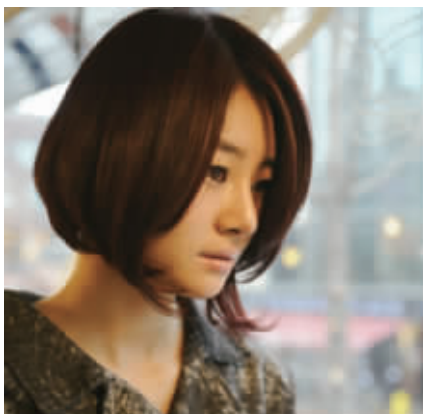
短发的烫发、电发讲究技巧哦,这样有着圆弧形的发型设计是最佳小脸型,隐约的卷发更有feel。