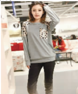
大胆运用拼接手法,采用灯芯绒面料,与针织的拼接,不同质地的碰撞,营造不可凡响的效果,充满大牌的气息。