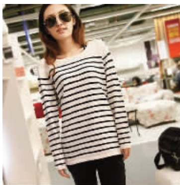
条纹海军风再次盛起。永不落伍的条纹,肩部拼色处理,明亮却不浮夸。肩部订扣装饰,起到画龙点睛的作用。