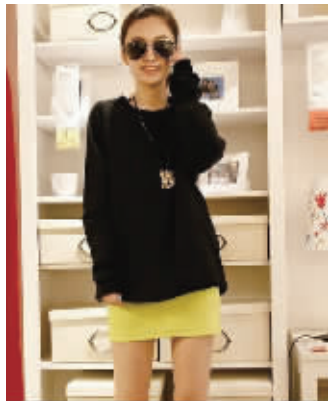
宽松的版型,上等面料,最大程度的体现穿着舒适度。