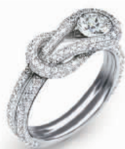
Forevermark 永恒印记 Encordia 拥爱系列

由专家精心打造的这款 Encordia 拥爱系列的单颗美钻密镶戒指,以 Forevermark 永恒印记美钻将爱结紧扣相系,其设计灵感来自古希腊的赫拉克勒斯之结,通常被称作“爱结”,象征着两个人之间最牢固的一生相守,也表达出爱侣之间永难分舍的爱情誓言。