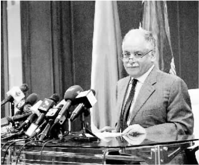
资料图:利比亚前总理马哈茂迪