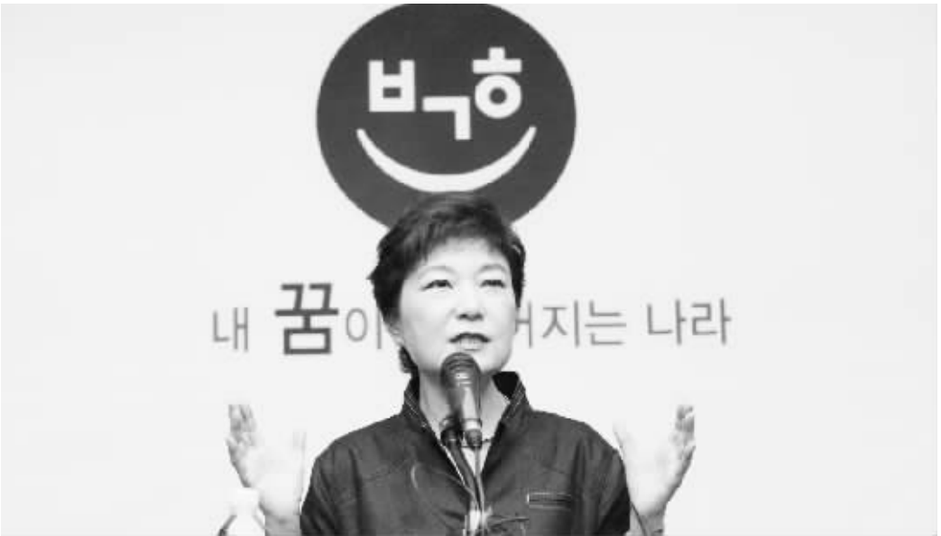
7 月 10 日,韩国执政党新国家党实际上的党首、前总统朴正熙长女朴槿惠在首尔参加活动。

朴槿惠说,韩国正处于“关键时刻”,面临老龄化社会、低生育率和青年人就业难;为实现国民幸福,需要推动经济民主化、创造就业岗位和制定合适的福利政策。 经济民主化以实现“经济公平”为主题。她说:“我们的经济模式过于注重效率,忽略公平的重要性。结果,贫富差距拉大,社会不平等变得严重。” 朴槿惠承诺增加服务业和科学技术投入,取消“不必要的监管”,同时,采取更严格措施让“那些影响力巨大、似乎无所不能的企业履行应有的社会责任”。