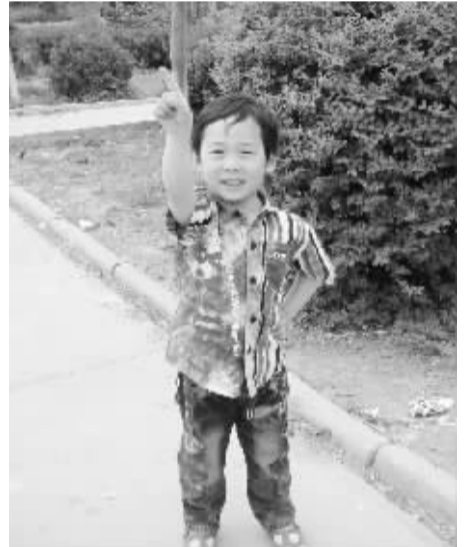
快看快看,天上有头牛在飞。为什么天上有牛在飞,呼呼,那是因为我在地面上吹。