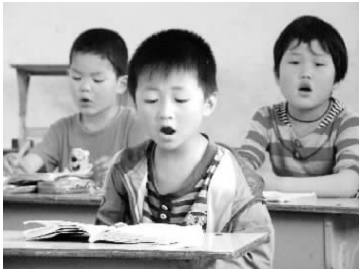
诵千古经典,做少年君子