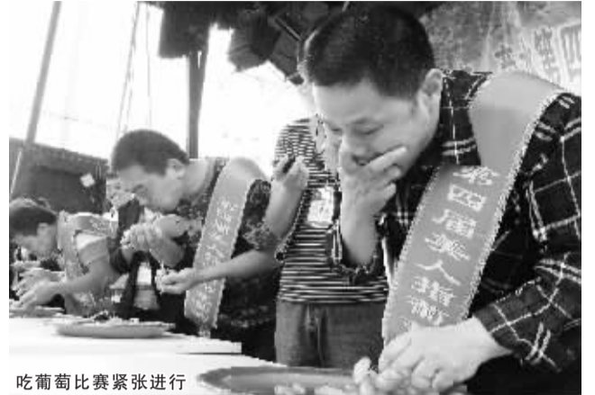
吃葡萄比赛紧张进行