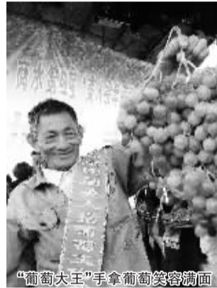
“葡萄大王”手拿葡萄笑容满面

9月13日上午,由周口市旅游局、商水县政府主办,商水县委宣传部、商水文广新局承办的商水县第四届葡萄文化节精彩开幕。开幕式上,除了传统的节目表演外,还举行了吃葡萄大赛和“葡萄大王”的决赛。最终,一选手以2分12秒吃下了1公斤葡萄的“神速”夺得吃葡萄大赛冠军,一种植大户以单串葡萄净重2.5公斤夺得“葡萄大王”称号。