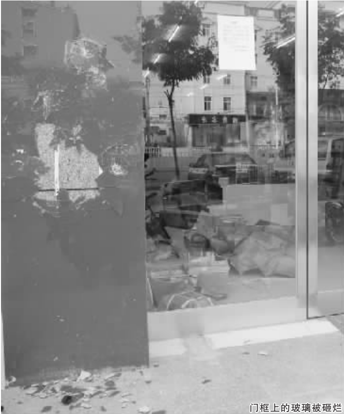
门框上的玻璃被砸烂