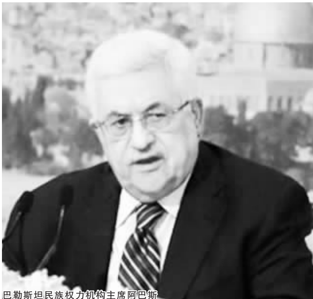
巴勒斯坦民族权力机构主席阿巴斯

2011年9月，巴勒斯坦向联合国秘书长潘基文递交申请，寻求成为联合国正式会员国，但因美国和以色列反对而未能获得安理会支持。巴勒斯坦今年9月转而寻求成为联合国观察员国。