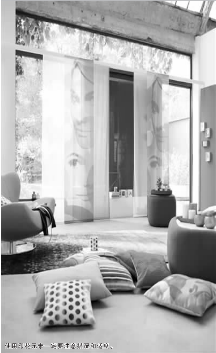
使用印花元素一定要注意搭配和适度。