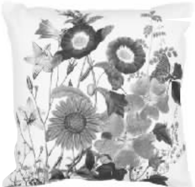
夸张的花蕊图案,让靠包清新而甜美。