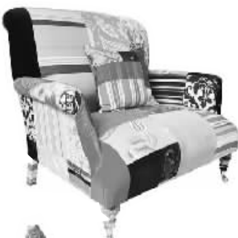
拼接和印花是本季的最潮选择。