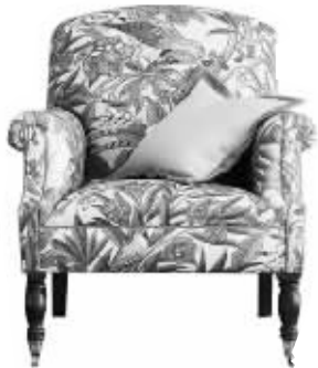
时下大热的热带风情的印花。