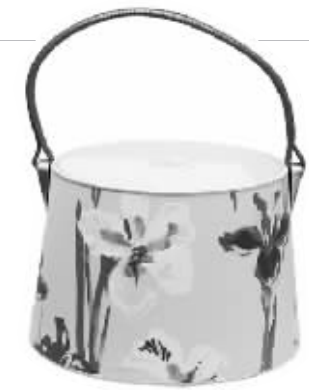
油画图案的水仙装点灯罩让人安静。