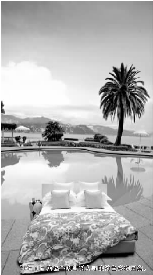
FRETTE 床品呈现出耐人寻味的色彩和图案。