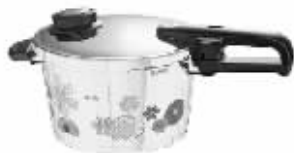
在印花当道的这个夏季,色彩和花纹连高压锅都不“放过”。