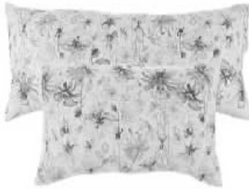
淡淡的花朵让空气中都弥漫着花香的味道。