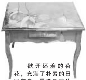
欲开还羞的荷花,充满了朴素的田园气息,晕染手法让方桌更加时尚。