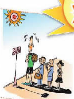
大个儿后面好乘凉