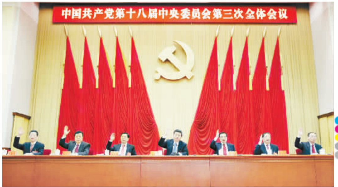
中国共产党第十八届中央委员会第三次全体会议,于2013年11月9日至12日在北京举行。全会由中央政治局主持,中央委员会总书记习近平作重要讲话。