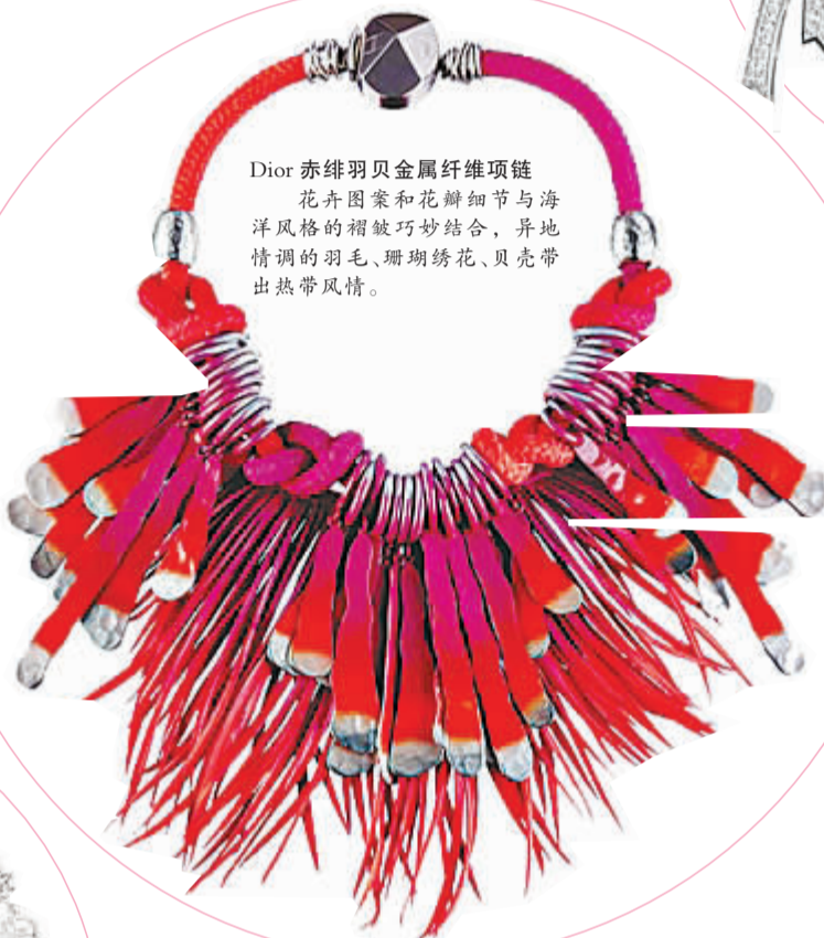
Dior 赤绯羽贝金属纤维项链

采用施华洛世奇为今季特别设计的印花皮革之余,更通过刺绣技术缀有色彩缤纷的仿水晶,如同装饰华丽的衣领,与服装融为一体。