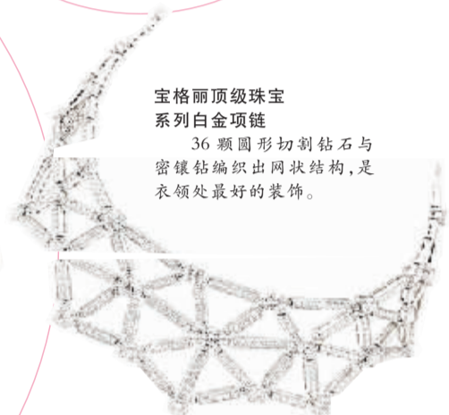
宝格丽顶级珠宝 系列白金项链

整个系列与法国王后玛丽安托瓦内特记忆中的片段相关,这款项链中一连串宝石在末梢形成一个精美的蝴蝶结,如同向王后的华丽服饰致以敬意。