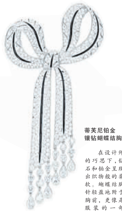
蒂芙尼铂金 镶钻蝴蝶结胸针

服装和珠宝,这两个时尚舞台最重要的元素,在 T 台上也常常进行着一场“无声的战役”,究竟是服装的廓形色彩最先声夺人,还是珠宝的闪耀材质最吸引目光,品牌和设计师往往要有所取舍。如今的趋势却是,服装与珠宝彼此融合,当两者成为协调的整体,双方都成了这场战役的赢家。