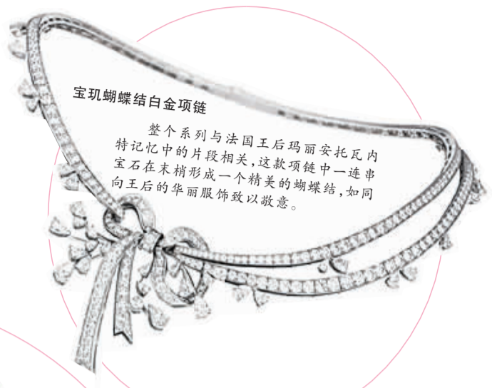
宝玑蝴蝶结白金项链

花卉图案和花瓣细节与海洋风格的褶皱巧妙结合,异地情调的羽毛、珊瑚绣花、贝壳带出热带风情。