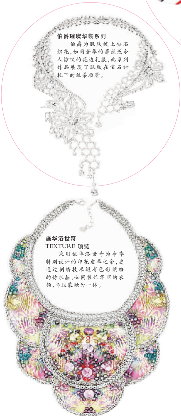
施华洛世奇 TEXTURE 项链

在设计师的巧思下,钻石和铂金呈现出织物般的柔软。蝴蝶结胸针轻盈地附于胸前,更像是服装的一部分。