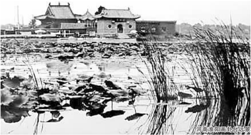
河南淮阳画卦台远景

虽然阳爻和阴爻的符号,来源于实象取义,或者说它们是实有之“象”的一个简笔画,可它们一旦形成符号,就不再是实象了,或者说它们已经被抽象成了我们的审美对象。原因