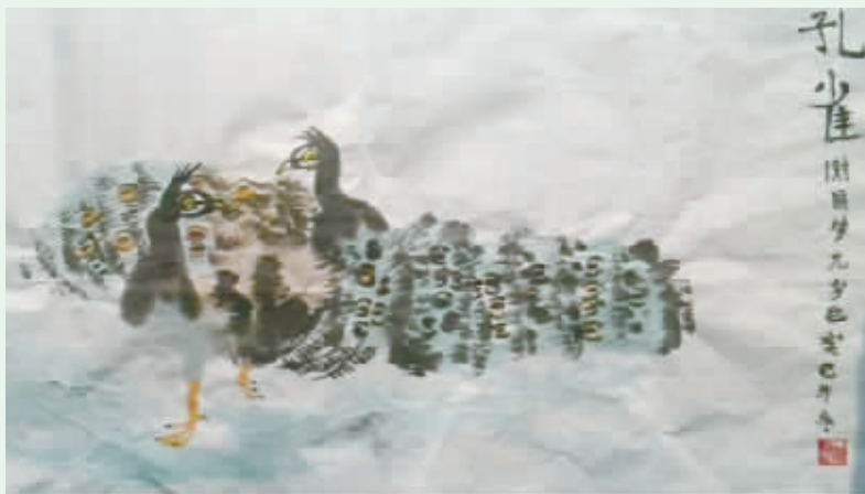
周口闫庄小学四(2)班 谢圆梦 编号:130273