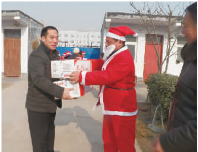
川汇区福利院接受“圣诞老人”送来的邦杰水饺

当日是冬至,11 时许,5 名小记者作为代表,随同周口优尼卡外语学校及“圣诞老人”前往川汇区社会福利院,看望生活在那里的孤残儿童,为他们送去了袜子、手套、画板等礼物。两件优质邦杰水饺,也为他们带去新年的美好祝福。