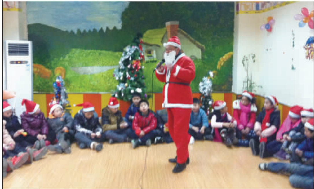
“圣诞老人”说圣诞节