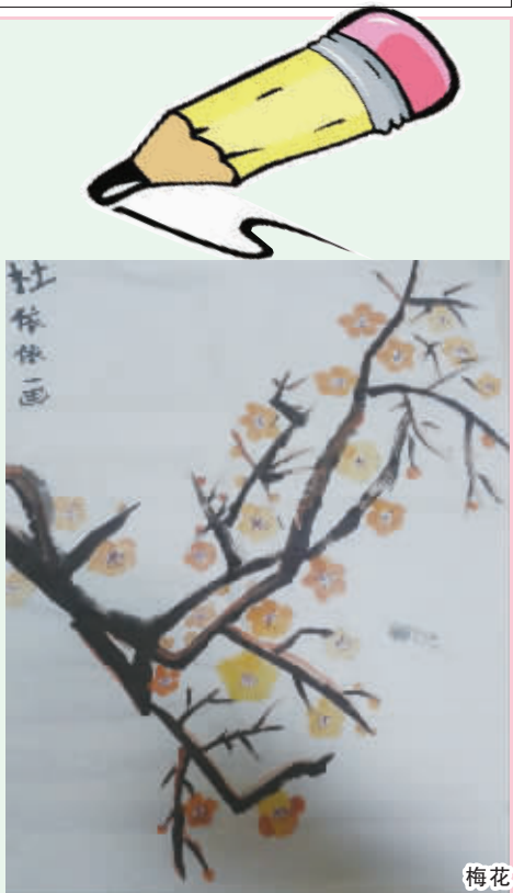
周口六一路小学四(2)班 杜依依 编号:131137