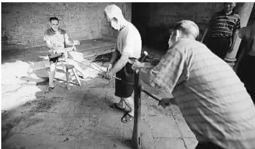
打绳现场 (资料图片)

绳,是我们的日常用品,与我们的生活息息相关,大的绳又叫绞,产生于农耕时代,历史相当久远。专门从事打绳的人叫做打绳匠,也是从农耕时代开始的民间艺人的一种。自古以来,绳的种类繁多,打绳匠也就分为很多种:皮绳是皮匠剥出来的;毛绳是由织毛衣的人绞出来的;草绳大多是农民用手捻出来的,布绳则是农村妇女随手搓出来的。打绳匠在改革开放之前很是吃香,到了上世纪九十年代,由于机械化代替了手工,至今,在周口市的城乡已很难见到纯靠手工打绳的匠人的身影了。