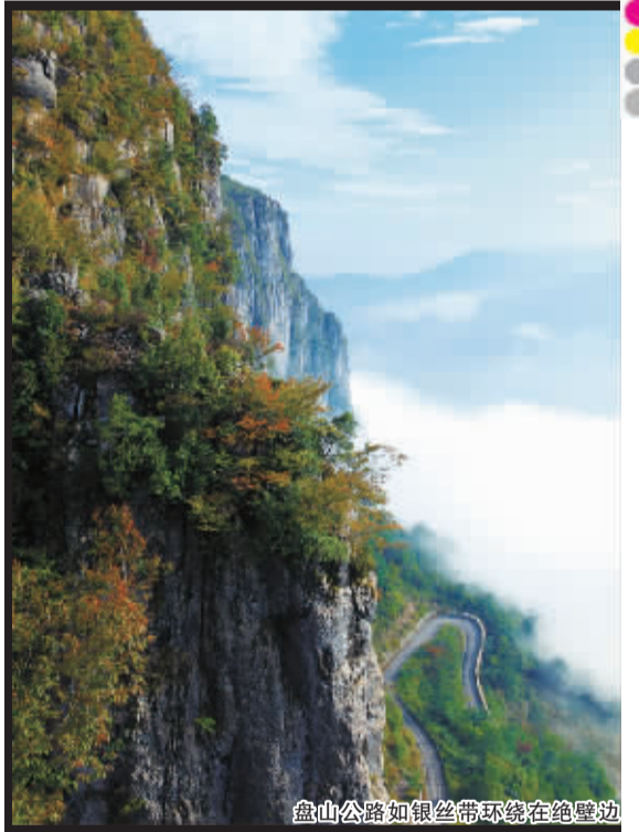
盘山公路如银丝带环绕在绝壁边

从地理学上讲,由于长江水系、清江水系长期交错的影响,不断地侵蚀,不断地冲刷,才形成如今陡峭的石柱,由于保存极度困难,所以地球上类似细长的石柱并不多见,而最长最大的莫过于此。