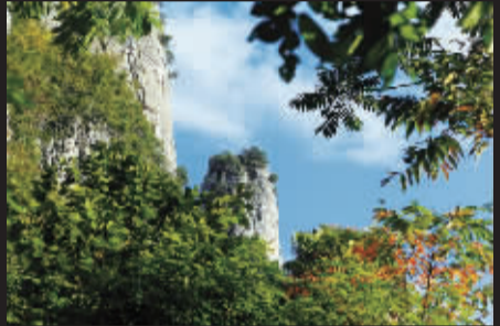
打过霜的树叶色彩斑斓,大自然自如的调色盘