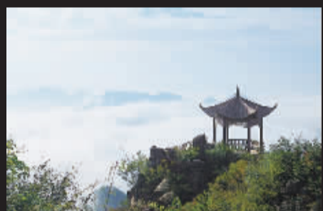
站在高处看风景,凉亭是意境,云雾是一景