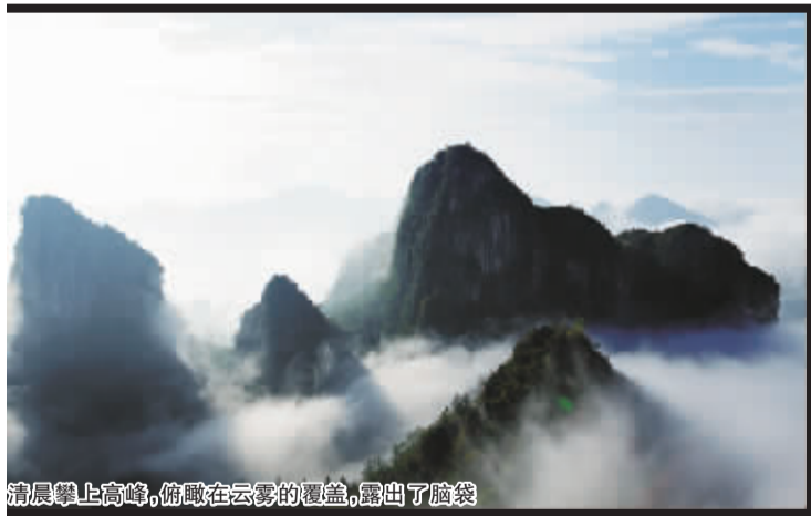
清晨攀上高峰,俯瞰在云雾的覆盖,露出了脑袋

人们常爱将恩施大峡谷说成是沐抚大峡谷,沐抚这个地名尤其特别,其中自有一段来历。相传在过去的沐抚镇大、小楼门一带曾居住过一个神秘民族,清朝“改土归流”后它没有归附,清政府在马者设县丞署对其辖制,诏令它进贡大米,皇帝回赠礼品。“沐抚”是这个民族被清王朝征服后新建的集市,取名“沐抚”意即受到皇恩沐浴与抚慰。(赖书香)